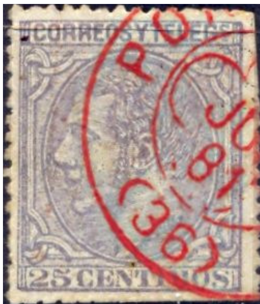
Trébol rojo (Pontevedra). Pieza única conocida. (Colección Eugenio de Quesada).

Hay ocasiones en que el esfuerzo y la constancia en un estudio en marcha (o, más bien, un fruto positivo de la neurosis obsesiva que caracteriza a buena parte de los filatelistas), obtienen su recompensa. Encontrar un trébol de cuatro hojas es lo que me ocurrió cuando, hace años, emprendí, en el Ágora de Filatelia una primera catalogación de tipos, colores y variaciones del fechador tipo Trébol de 1878. Trabajo que completé con el estudio sobre “El Trébol y el Alfonsillo” , publicado en ‘Academus’ , órgano oficial de la Real Academia Hispánica de Filatelia e Historia Postal, y materializado en la colección de cinco cuadros del mismo título, que obtuvo medalla de Vermeil Grande en la Exposición Filatélica Nacional.