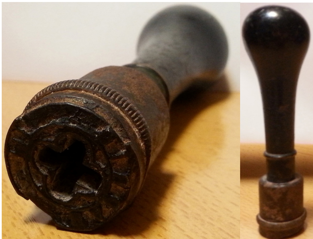
Cuño original del fechador tipo Trébol de 1878. Imagen de Alejandro Gracia. (Fuente: Museo del Correo. Director: Evaristo Alfaro).

Las cinco tintas | El estudio del Trébol sobre el Alfonsillo (en que se aúnan dos de mis “debilidades”: el fechador de 1878 y el sello de 1879), permitió revelar la existencia de cinco colores del Trébol, en función de las tintas de estampación del matasellos. Como es sabido, el color del Trébol es, generalmente, negro. Menos frecuentes son las estampaciones que se efectuaron con tinta azul. Existe también, aunque es mucho menos habitual, el Trébol verde (Chiclana, Fromista, Guadalcanal, Valencia de Alcántara, Vélez-Rubio...). Siendo raras las estampaciones en violeta (Yecla, Jerez de los Caballeros...). Y, claro está, el Trébol rojo, del que desde su descubrimiento hasta la fecha, sólo se conoce un ejemplar (correspondiente a la Administración de Pontevedra).