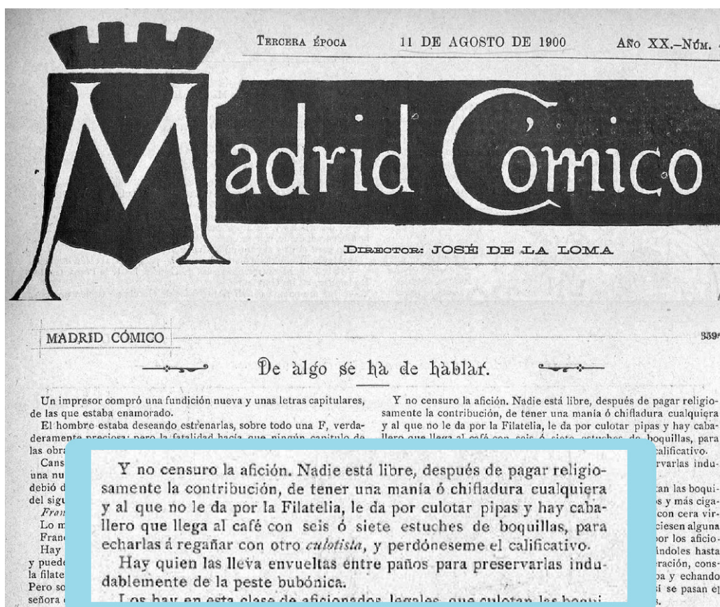
La Filatelia como “Manía” ó “Chifladura”. (Periódico ‘Madrid Cómico’, 11.08.1900)

El periódico satírico Madrid Cómico de 11 de agosto de 1900, lleva en su interior un artículo en el que quién lo suscribe nos sigue tratando de “chiflados” llenos de manías...