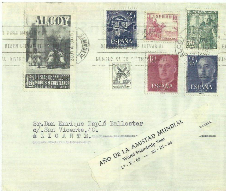
Carta circulada a Alicante en 1966 con viñeta publicitaria de la Asociación de San Jorge de Alcoy

La emisión de estas primeras viñetas con imágenes de las fiestas patronales alcoyanas empiezan a ser conocidas por el público en general y su uso comienza a propagarse a través del correo, lo que provoca un aumento del interés entre los coleccionistas filatélicos del momento.