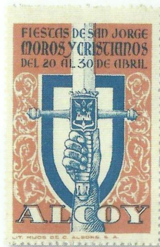
Viñeta de 1950 con leyenda "Fiestas de San Jorge / Moros y Cristianos / del 20 al 30 de abril". Pie de imprenta "Lit. Hijos de C. Alborns S.A."

con la falta casi total de la impresión del color azul en la viñeta inferior izquierda; esta impresión en azul queda, pues, impresa en el engomado del dorso.