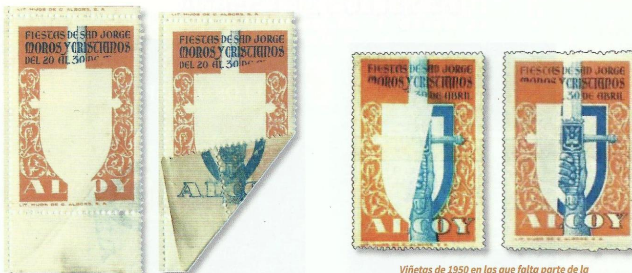
Viñeta de 1950. Bloque de 6. Ampliación de las viñetas sin impresión de color azul en anverso e impresión de éste en el reverso engomado