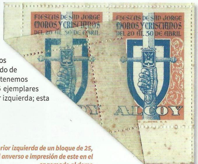
Viñeta de 1950. Ampliación de la esquina inferior izquierda de un bloque de 25, con la ausencia de impresión del color azul en el anverso e impresión de este en el engomado al dorso

Después de 67 años y con los muy pocos ejemplares que puedan quedar en hojas completas o en grandes bloques, hemos podido recopilar algunos con los errores y variantes de impresión más interesantes y curiosos de esta viñeta. Se conocen al menos tres variantes producidas por el plegado de las esquinas de las hojas. Así pues, tenemos constancia de un gran bloque de 25 ejemplares