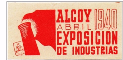
Viñeta publicitaria de la Exposición de Industrias. Esta se utilizaba en el dorso de la correspondencia.