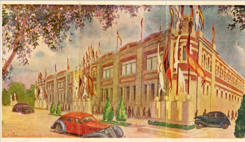
Imagen de la portada del tríptico publicitario de la Exposición de Industrias Alcoyanas con el edificio de la Escuela Superior de Ingenieros industriales situado al lado del puente del Viaducto.

En 1923 empieza a levantarse un nuevo edificio sobre el antiguo tendadero de lanas de la Real Fábrica de Paños que, manteniendo su decidido apoyo a la enseñanza técnica, cedió gratuitamente el anterior solar. Esta construcción que finaliza sus obras poco antes de estallar la nefasta Guerra Civil Española, el edificio albergó en primer momento el Cuartel de los Carabineros y durante toda la duración de la Guerra Civil el Hospital Sueco-Noruego para combatientes. En 1939, al finalizar la Guerra Civil, el edificio acogió en la parte superior el Hospital del Generalísimo , en la plata intermedia la 1ª Exposición de Industrias de la ciudad y en los sótanos la Prisión Provisional .