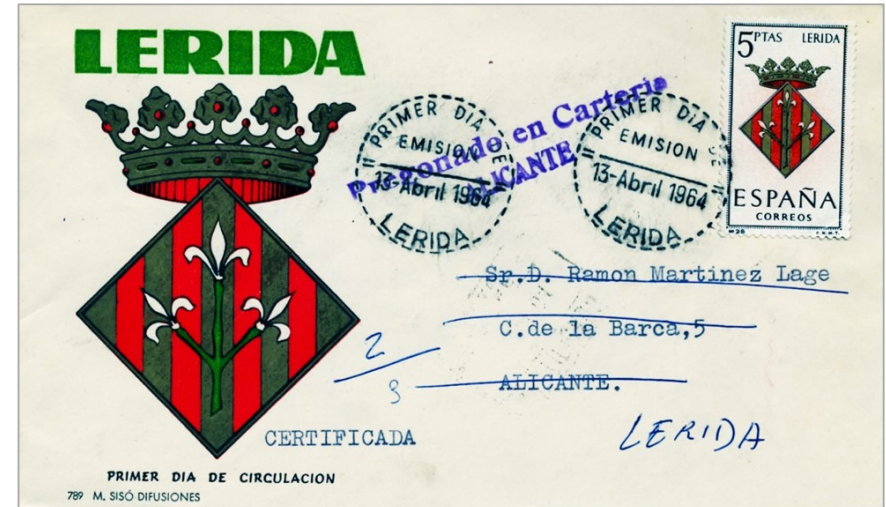
13-04-1964. Sobre filatélico de Lérida a Alicante. Franqueo hasta 120 Gr. Tarifa; 11-05-1959, 3,50 Ptas. + 1,50 Ptas. de derecho de certificado. Cancelación; fechador de Primer Día de Emisión de Lérida. Marca lineal de Pregonada en Cartería - ALICANTE en azul.

Su uso es debido a qué cuando el cartero de reparto de la correspondencia no ha encontrado al destinatario en la dirección indicada en el envío, y con el objetivo de hacer llegar el envío a la persona que va destinado, se dirige a consultar al resto de carteros, por si alguno tiene conocimiento de sus nuevas señas o realmente tiene que devolver el envío. Esta marca esta en ocasiones la podemos encontrar junto a las marcas de “Devuelto a su Procedencia”.