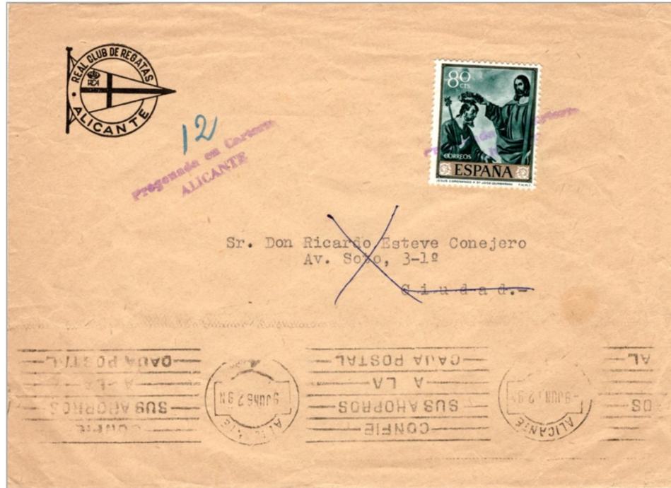
9-06-1962. Sobre de Alicante a interior. Franqueo hasta 20 Gr. Tarifa para interior de las poblaciones; 11-05-1959, 80 Cts. Cancelación; Rodillo de propaganda y marca lineal de Pregonada en Cartería - ALICANTE en violeta.

Cuando un envío postal, sea del tipo que sea, lleva una dirección deficiente que hace que el correo no pueda hallar al destinatario, trascurrido un tiempo prudencial (Dos meses, según marca el Reglamento de la UPU), la propia administración postal, sin cargo adicional alguno por el servicio, lo devuelve al remitente, si es localizable. Lo mismo sucede entre los correos de dos países diferente. Dicho objeto postal suele llevar marcas postales, manuscritas, tamponadas o ilustradas que indican la circunstancia. Ejemplos; “D”. “DEVOLUCIÓN AL REMITENTE”. “A SU PROCEDENCIA”, o simplemente la dirección anulada.