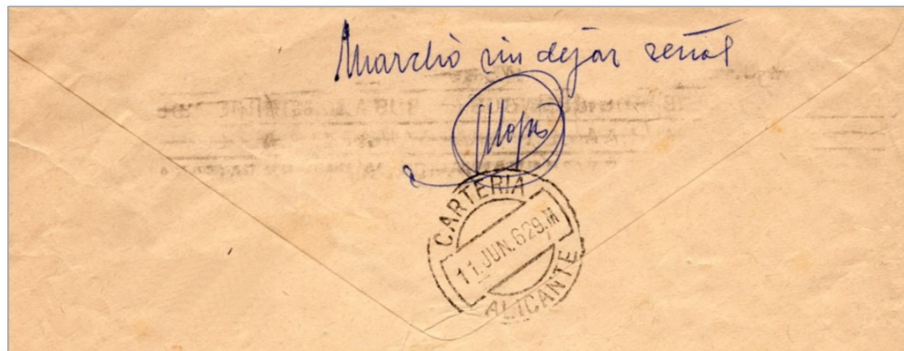
Imagen del reverso del sobre expuesto más arriba.