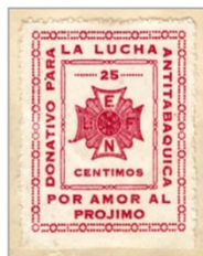
Imagen de la viñeta benéfica de 25 Cts. en el reverso del sobre expuesto a la derecha.

EL VICIO DE FUMAR TIENE A SU CARGO MAS MUERTES QUE LAS MAS MORTIFERAS EPI- DEMIAS Y LAS MAS CRUENTAS GUERRAS.