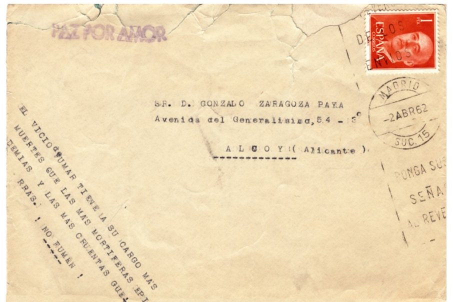
2-04-1962. Sobre de Madrid a Alcoy. Franqueo hasta 20 Gr. Tarifa; 11-05-1959, Pta. Cancelación; rodillo manual de propaganda de Madrid. Marca particular tamponada, “PAZ POR AMOR”.

Imagen de la viñeta benéfica de 25 Cts. en el reverso del sobre expuesto a la derecha.