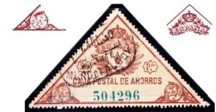
Muro de Alcoy. 10-04-1930. 50 Ptas. Castaño.