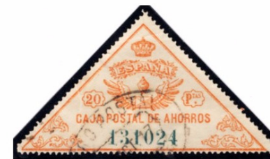
Alcoy. 20 Ptas. Naranja.