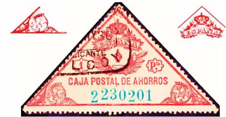
Alcoy. ¿?-05-1936. 1 Pta. Carmín.