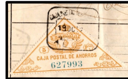
Alcoy. 19-10-1920. 5 Ptas. Amarillo.