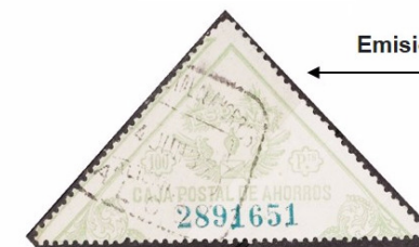
Alcoy. 4-06-1932. 100 Ptas. Verde opaco.