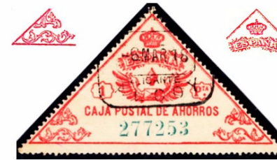
Alcoy. 6-03-1918. 1 Pta. Carmín.