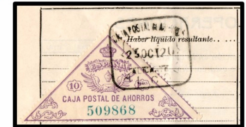
Alcoy. 25-10-1920. 10 Ptas. Violeta.

Imagen de los sellos adheridos a la libreta de la Caja Postal de Ahorros expuesta a la izquierda.