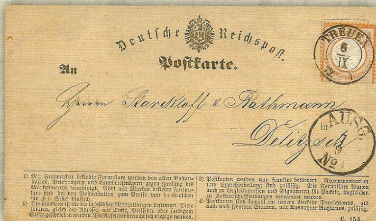
Entero postal Alemania Imperio sin sello impreso circulado en 1872

Con la emisión de la prime tarjeta postal oficial el 21 de octubre de 1869 por el Correo Austriaco, la correspondencia postal sufre una gran revolución con los llamados enteros postales, en ellos se podía enviar un pequeño mensaje por la mitad del precio de la correspondencia cerrada en un sobre. Esta tarjeta postal - entero postal tiene muy buena acogida, se venden muchos ejemplares y otras administraciones de Correos de otros países lo imitan. Muchos enteros postales se editan con la impresión en el anverso del Escudo de Armas del país o la imagen de su monarca en el ángulo superior izquierdo o en la parte superior central y en el ángulo superior derecho un sello con el valor