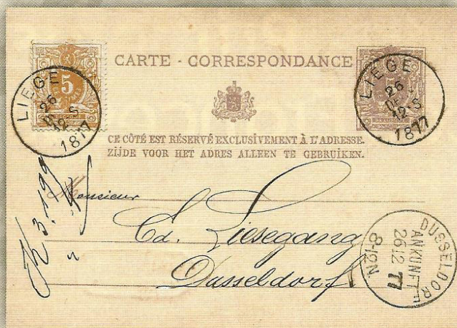
Entero postal de Bélgica circulado de Lieja a Düsseldorf en 1877

auténticas tarjetas máximas circuladas, son las de 1872 del Imperio Alemán, estos enteros postales no tienen sello impreso y llevan un sello adheridos de la serie de 1872 del águila en relieve donde se dan dos variantes: Pequeño escudo sobre el águila y Escudo grande sobre el águila.