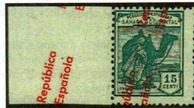
Sobrecarga desplazada verticalmente