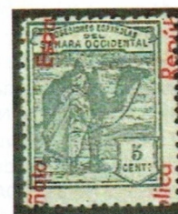
Emisión de 1931, Ed. 36. NO CATALOGADO