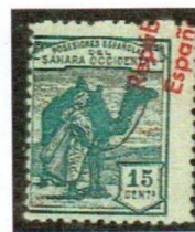
Sobrecarga muy desplazada, de tal manera que solo está la mitad

Es curioso que después de noventa años de esta primera emisión del Sahara Español aparecen variedades que no están aún catalogadas, por lo que al final de estas notas se expondrán unas cuantas de las variedades todavía sin catalogar, recientemente descubiertas, muy destacas y raras.