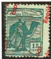
Sobrecarga desplazada "a caballo" entre dos sellos