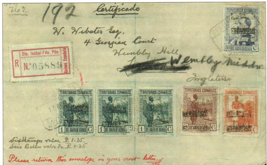
17 de agosto de 1933. Carta certificada de Santa Isabel a Inglaterra, franqueada con sellos de la emisión de 1932, con la sobrecarga REPÚBLICA ESPAÑOLA a mano

Ante la falta de sellos con la ahora indispensable habilitación “República Española”, el Gobernador General de los llamados “Territorios Españoles del Golfo de Guinea”, residente en Santa Isabel, en la isla de Fernando Poo, ordenó realizar una emisión provisional para cubrir las necesidades postales del momento, la cual se hizo sobrecargando a mano sellos de la monarquía que se pudieron recuperar de las distintas administraciones en la Guinea Continental, Fernando Poo y las islas de Elobey, Annobón y Corisco, pero siempre en poca cantidad, especialmente los valores de 4 y 5 Pesetas. Se hicieron forzosamente dos emisiones, la primera con la sobrecarga en color negro y la segunda en violeta, al terminarse el tampón de tinta negra, improvisándose otro con el referido color violeta. Como curiosidad marginal, con sobrecarga negra solo existen tres pliegos del 4 Ptas., o sea quince ejemplares, y con color violeta, dos pliegos, o sea 100 sellos, lo que prácticamente no es nada, catalogados en el Especializado Edifil de las Antiguas Dependencias Postales Africanas con los números Ed. 216A/229A con sobrecarga negra, y Ed. 216B/229B con sobrecarga violeta.