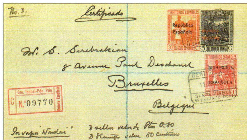
11 de enero de 1934. Carta certificada "Por vapor Wadai". Santa Isabel (Fernando Poo) a Bruselas (Bélgica). Franqueo 5 c. sin dentar + 25 c. rojo "REPUBLICA ESPAÑOLA" + 50 c. naranja "República Española". Etiqueta de certificado "C / Sta. Isabel-Fdo Poo / N° 09770 / Guinea Española"

De esta emisión solo existen dos valores sin dentar con la sobrecarga invertida, el 5 y el 10 cts., que son RARÍSIMOS, pues solo existe un pliego de 50 sellos cada uno, con la siguiente numeración en el 5 cts., A.001.155 y el 10 cts. con A.001.284. En los últimos veinte años solo los vi ofrecidos una vez en una subasta, al venderse una gran colección de Guinea, los cuales tuve la oportunidad de adquirir. No sé por qué razón el catálogo especializado les pone a cada sello una cotización distinta, pues ambos tienen la misma tirada, el 5 cts. 90 euros, y al 10 cts. 51 euros, siendo igual de raros. Se conocen unos sobres en los que estos dos sellos van franqueados conjuntamente con otros valores de las series Ed. 216/229 y Ed. 230/243, con el referido franqueo correcto, y cartas certificadas, todas ellas enviadas a Bruselas (Bélgica) desde Santa Isabel en la isla de Fernando Póo. Personalmente tengo tres de estos sobres en mi colección, todos con sus correspondientes matasellos de salida y llegada. El valor de 5 cts. tiene la sobrecarga invertida "República Española" siempre desplazada ligeramente hacia la izquierda. La cotización actual de estas variedades en el Catálogo Especializado Edifil me temo que no es la correcta, pues la vista de su GRAN RAREZA tendrían que valer tres o cuatro veces más de lo señalado, por lo menos, pues prácticamente no existen en el mercado filatélico.