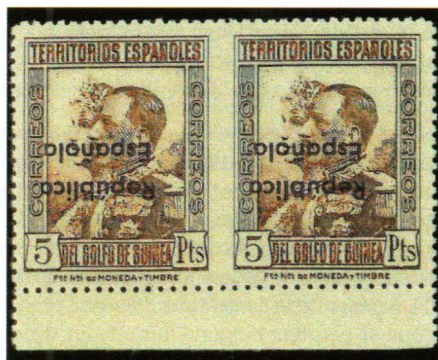
Pareja horizontal sin dentar entre los sellos. Sobrecarga invertida. Parejas horizontales de 4 y 5 Ptas. de la parte inferior del pliego. Solo existen cinco parejas con esta variedad y la numeración al dorso A.000.095 y A.000.200