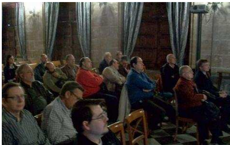
El conferenciante, en La Lonja de Valencia, y parte del numeroso público asistente.