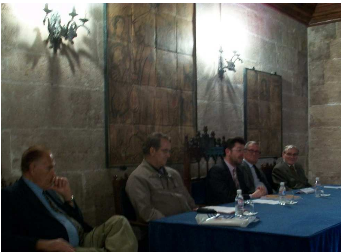
Los presidentes del Centro de Estudios Filatélicos de Valencia, del Gremio de Filatelia, de la Comisión de Turismo de Valencia y Cámara Oficial de Comercio e Industria y de la Sociedad Valenciana de Filatelistas, durante la intervención inicial del autor, en La Lonja de Valencia.