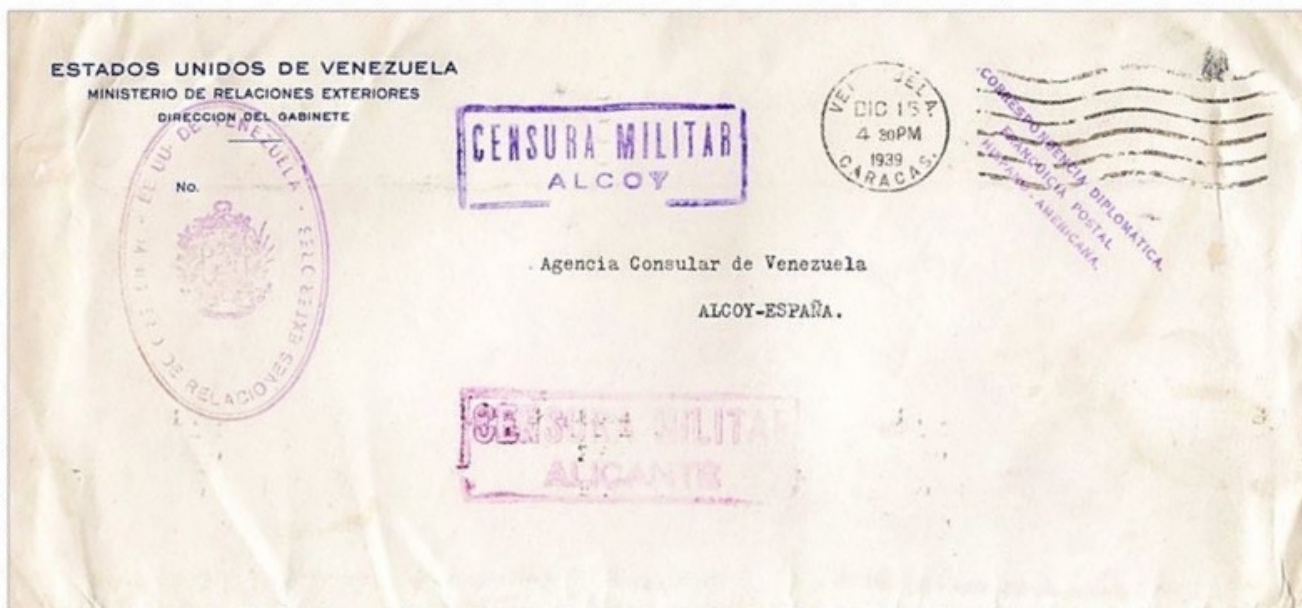
15-12-1939. Carta de Caracas (Venezuela) a Alcoy. Cancelación; fechoro rodillo mudo de 6 líneas onduladas. Marca de Censura Militar de Alicante en rojo (aplicada en tránsito) y Marca de Censura Militar de Alcoy en azul a la llegada.

En este sobre, (donde aparece un sello oficial y propio del Ministerio, tamponado en color violeta bajo el remite), podemos apreciar una marca propia de franquicia en tres líneas (también por tampón de color violeta) en la que se lee “CORRESPONDENCIA DIPLOMÁTICA / FRANQUICIA POSTAL / HISPANO-AMERICANA” (sobre la que se ubica el matasellos de rodillo mudo de ondas de la capital, Caracas, con fecha de salida en 15 de diciembre de 1939) :