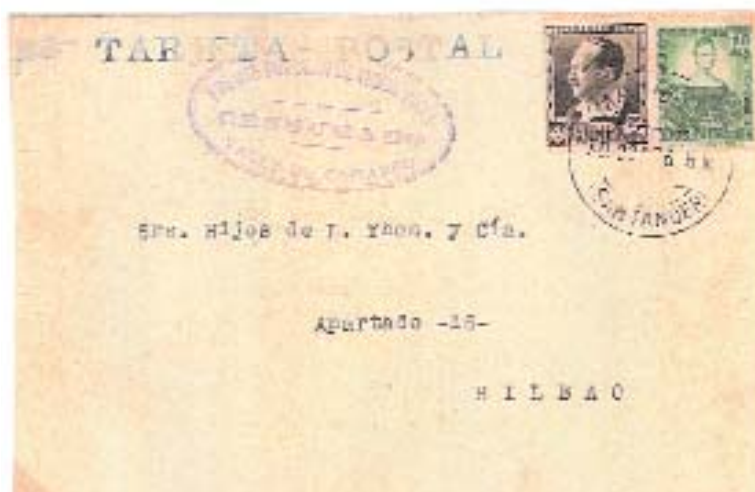
Tarjeta postal circulada de Maliaño a Bilbao. Franqueo correcto de 15c con matasellos MALIAÑO (SANTANDER) 30 OCT 36.8M. Lleva la marca ovalada de censura, violeta, FRENTE POPULAR DE IZQUIERDAS/CENSURADO/VALLE DE CAMARGO, no catalogada.