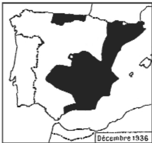
Mapa peninsular en el que se marca en negro los territorios leales al Gobierno de la República en diciembre de 1936, según interpretación de Michel Colas en "Censures, marques et correspondances de la Guerre Civile d'Espagne", tomo II. Nantes, 1970.

Ayudan también los catálogos y recopilaciones de censuras y otras marcas republicanas publicados, de los que mencionamos: